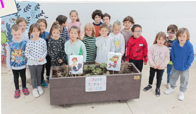
P4 CLASSE DE LES