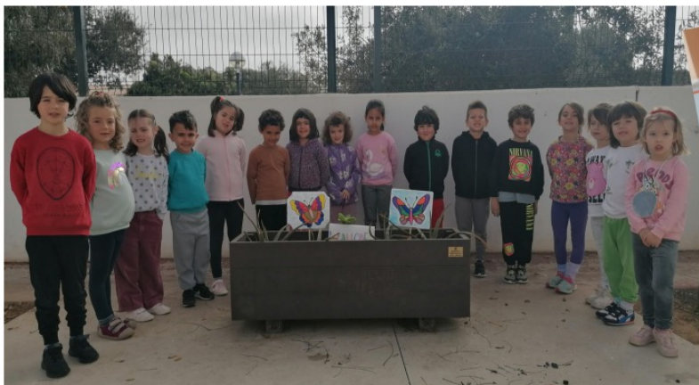
P5 CLASSE DE LES